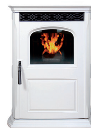
gris clair frost